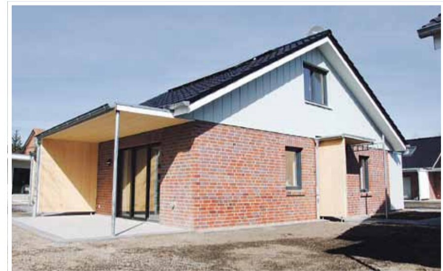
Fünf Häuser sind noch zu haben.

Für gemeinsame Aktivitäten wie Feiern und Erzählen, Kochen und Genießen, private Feste mit Freunden oder der eigenen Familie, für gemeinsame TV-Sendungen und mehr steht allen Bewohnern, neben den dafür gestalteten Außenanlagen, das Gemeinschaftshaus der Wohnanlage zur Verfügung. Hier darf die gemeinsame Zeit drinnen und auch draußen auf der Terrasse verbracht werden.