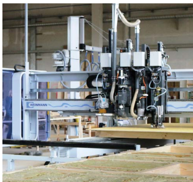
Am Schautag findet eine Vorführung der Fertigungsanlage statt.

stehen zukünftigen Bauherren gern Rede und Antwort an unserem Schautag.“ Eine vorherige Anmeldung ist nicht erforderlich.